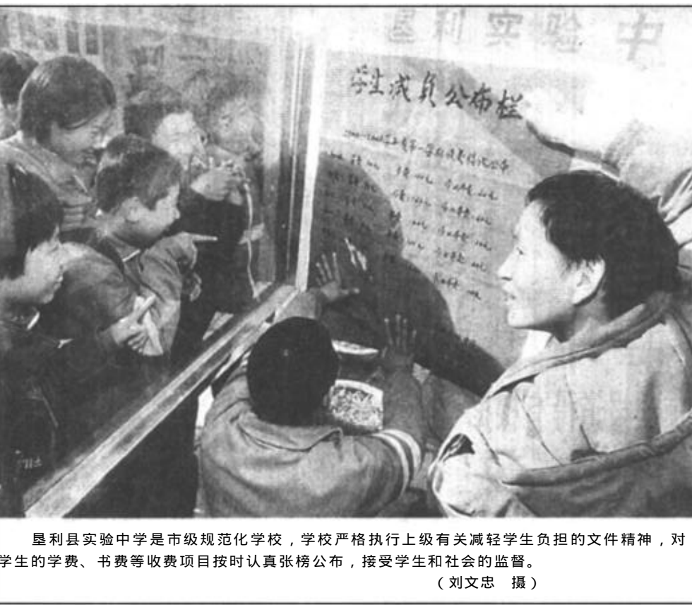
垦利县实验中学是市级规范化学校,学校严格执行上级有关减轻学生负担的文件精神,对学生的学费、书费等收费项目按时认真张榜公布,接受学生和社会的监督。

“减负”工作是当前教育工作的热点,广饶县西营乡冯庄中心小学在“减负”热中进行了冷思考,认为既要“减负”,更要“增效”,否则将贻误一代人。为此,该校在开展“减负”与“增效”的同时,与全面实施素质教育相结合;与思想政治教育、道德教育、法制教育、纪律教育相结合;与各科教学相结合。使“减负”与“增效”工作渗透到各科教学之中;与学校、团队、班级等相结合;把“减负”与“增效”工作贯穿于学校教育教学和一切活动中,收到了良好的社会效果。 (郭家胜 冯勤俭)