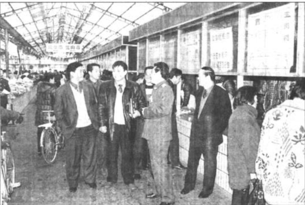
东营工商分局胶州路工商所积极推行市场规范化建设,使胶州路农贸市场、工业品市场交易秩序井然。